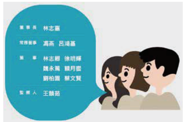
圖一 任董事及監察人

社工遭起訴後，協助轉介的兒福聯盟也遭批管理不周。立委質疑，兒盟收出養業務歸衛福部管，但 會務、財務等卻隸屬教育部 ，無法有效管理兒盟社福工作。衛福部社家署代理署長張美美今(13)證實，9月3日起兒盟主管機關已全權變更為衛福部。民進黨立委林月琴今指出，兒盟員工有4分之3為社工，業務涵蓋收出養、弱勢家庭服務、親子館等，都屬於社福範疇，教育部對收出養業務了解不足，無法有效管理，經立委與各部會協調、爭取，兒盟已在9月3日正式改隸至衛福部管轄。張美美說明，剴案爆發後，立委及各界持續關心兒福聯盟主管機關問題，教育部也有詢問衛福部相關管理權責，加上兒盟也主動申請更改主管機關，因此決定正式變更兒盟主管機關為衛福部，並移除原名稱中「文教」二字，更名為「財團法人中華民國兒童福利聯盟基金會」。張美美表示，相關團體管理都是依照財團法人法規定辦理，過去兒盟的 會務、財務 由教育部